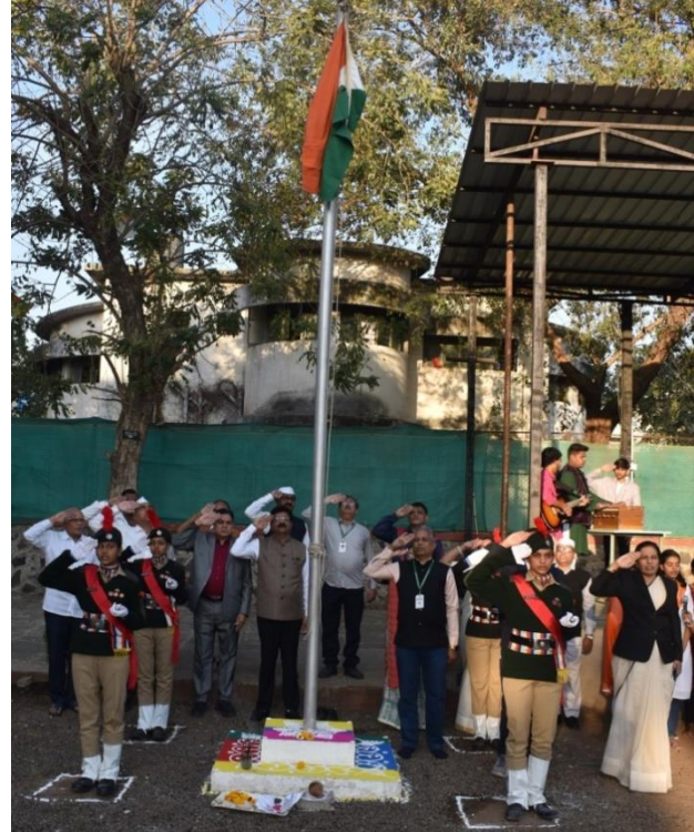
26 th Jan: Republic Day