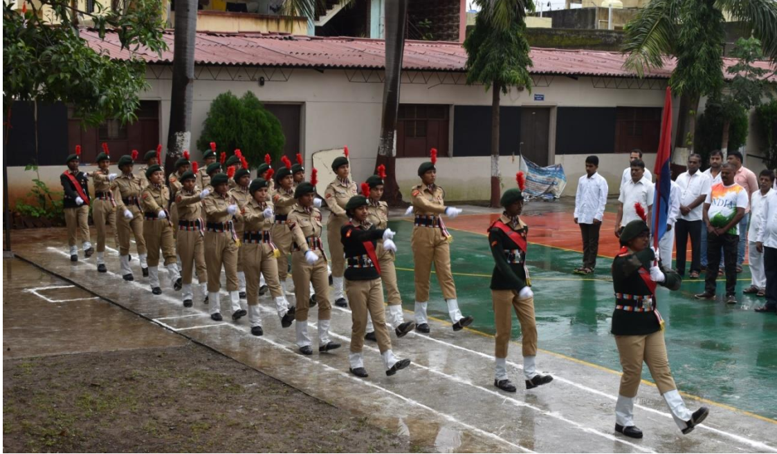
NCC Parade on the occasion of 15 th Aug. Independent Day