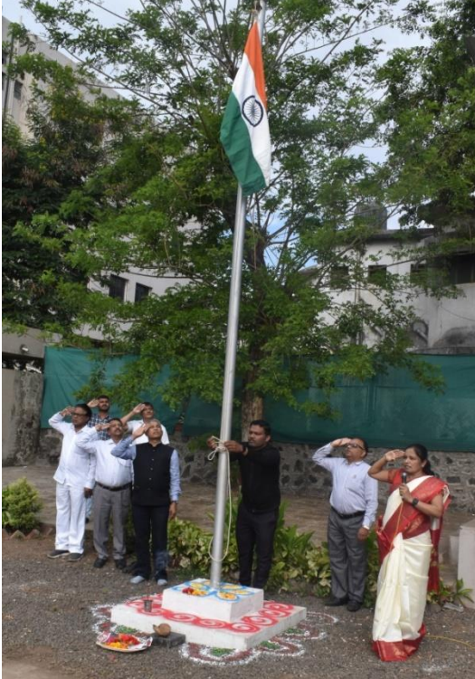
Celebrating 1 st May: Maharashtra Din